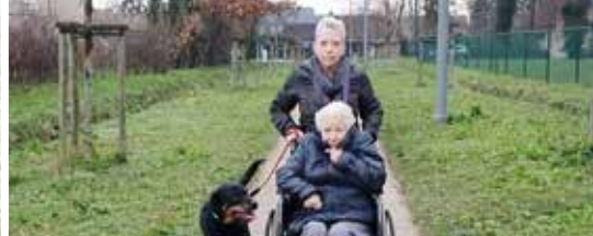
Een toegankelijke gemeente (p. 3)