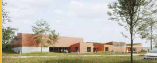
De 12 werken: fuif- en evenementenzaal (p. 2)